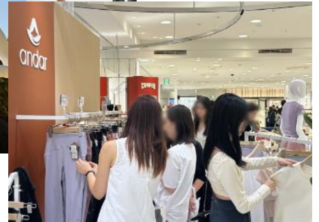
△ 안다르 일본, 나고야 백화점 팝업 현장