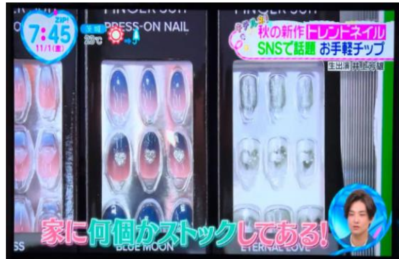
△ 일본 TBC 대표 모닝 프로그램 <ZIP!>에서 SNS에서 화제가 되고 있는 네일로 소개