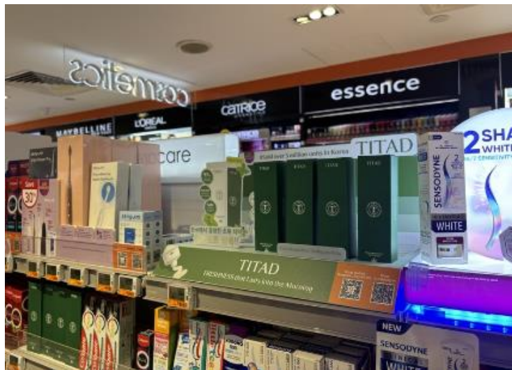
△ 싱가포르의 올리브영 '가디언' 입점