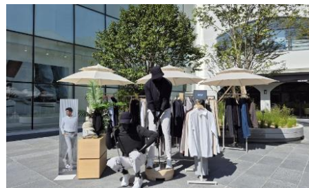
△ 안다르 맨즈 동부산 팝업