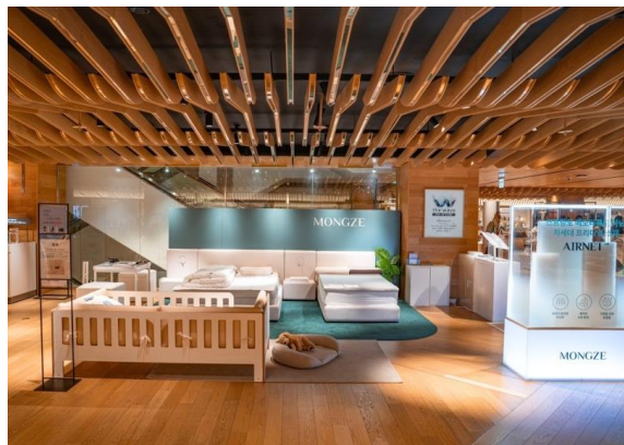
△ 롯데백화점 명동 본점 몽제 매장 전경

▲ 후원율 74% · 순입력 2024.10.01 16:04 · 댓글 10개