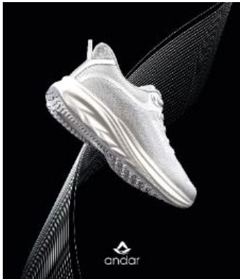
△ 신제품 러닝화 '제트 플라이'