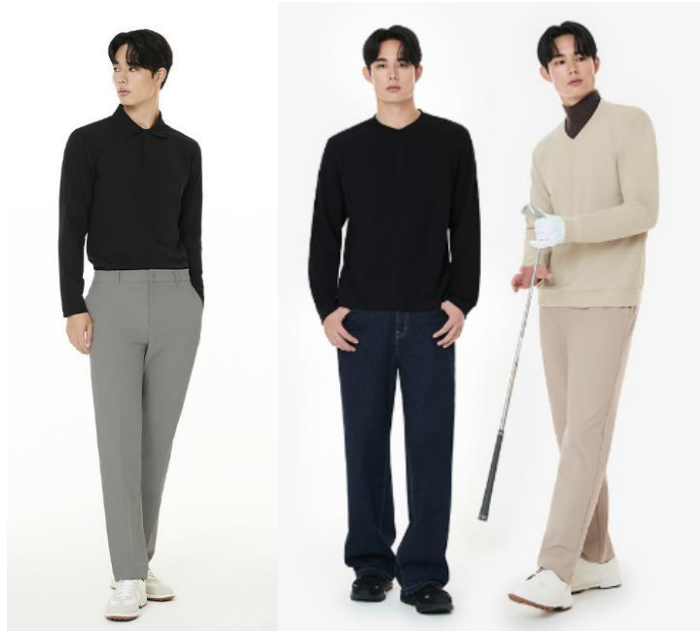
△ 신제품 '어반액티브 맨즈 슬랙스'