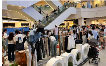
△ 안다르 맨즈 기흥 프리미엄 아울렛 팝업