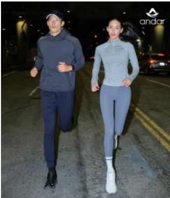
△ 러닝 카테고리 확대