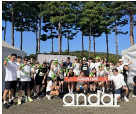
△ 마라톤 참여 및 러닝크루 활동